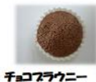
チョコブラウニー